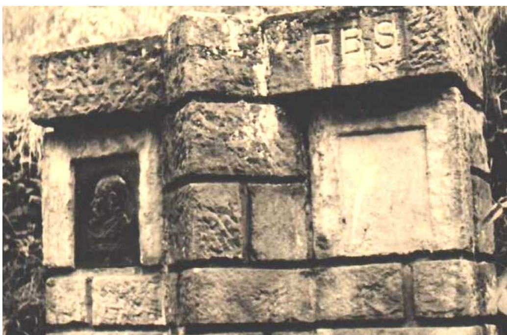
Masarykova studánka zřejmě v 80. letech ještě s portrétem prvního prezidenta. Vpravo jsou vytesaná písmena RBS na paměť Rosické báňské společnosti, která dala studánku v roce 1928 upravit.

V rámci přípravných prací nás jako Vlastivědný spolek samozřejmě zajímala také historie studánky. Jak jsme se ale přesvědčili, nic není tak jednoduché, jak se na první pohled zdá. O minulosti Masarykovy studánky to platí dvojnásob. Tajemstvím není zahalený jen samotný vznik studánky, ale především její 80letá historie. Ale po pořádku.