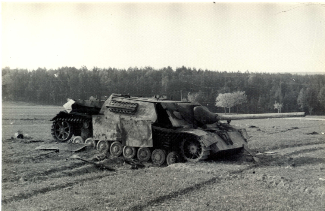
Tank u cesty z Lukovan do Popovic (jiný pohled). Číslo na tanku 223.