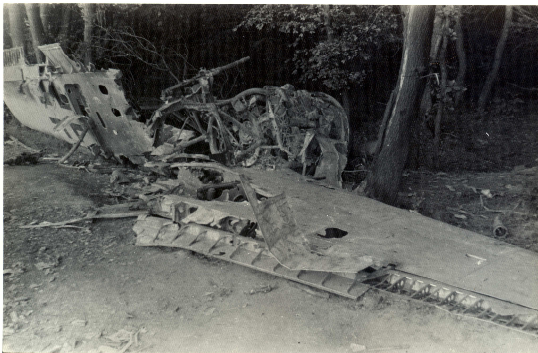
Sestřelené letadlo snad u Rosic.