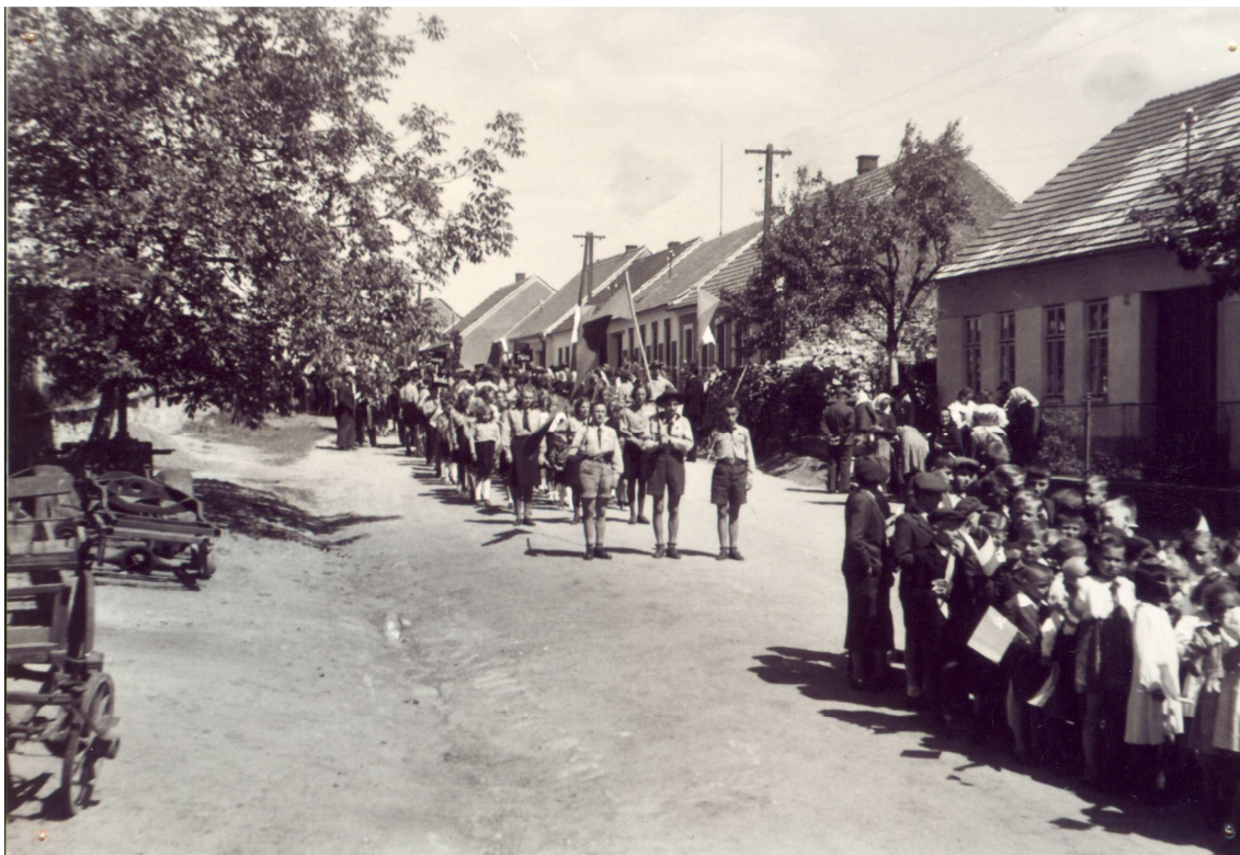
Pochod od kapličky.