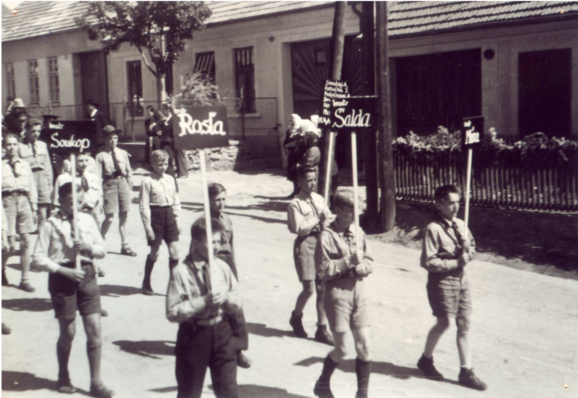
Bratr Soukop, bratr Rost'a, bratr Šalda, bratr Míra.