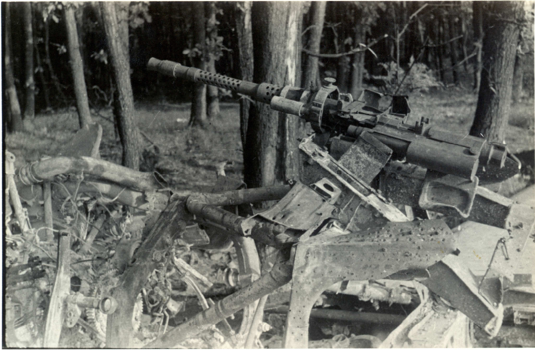
Kulomet u Lukovan. Jeden kulomet byl u ve Bzovce a druhý u křížka (Chvátalových). Který je tento není jasné.