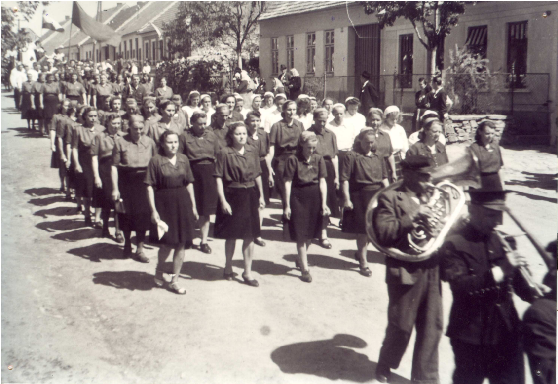
Ženy v červených halenkách.