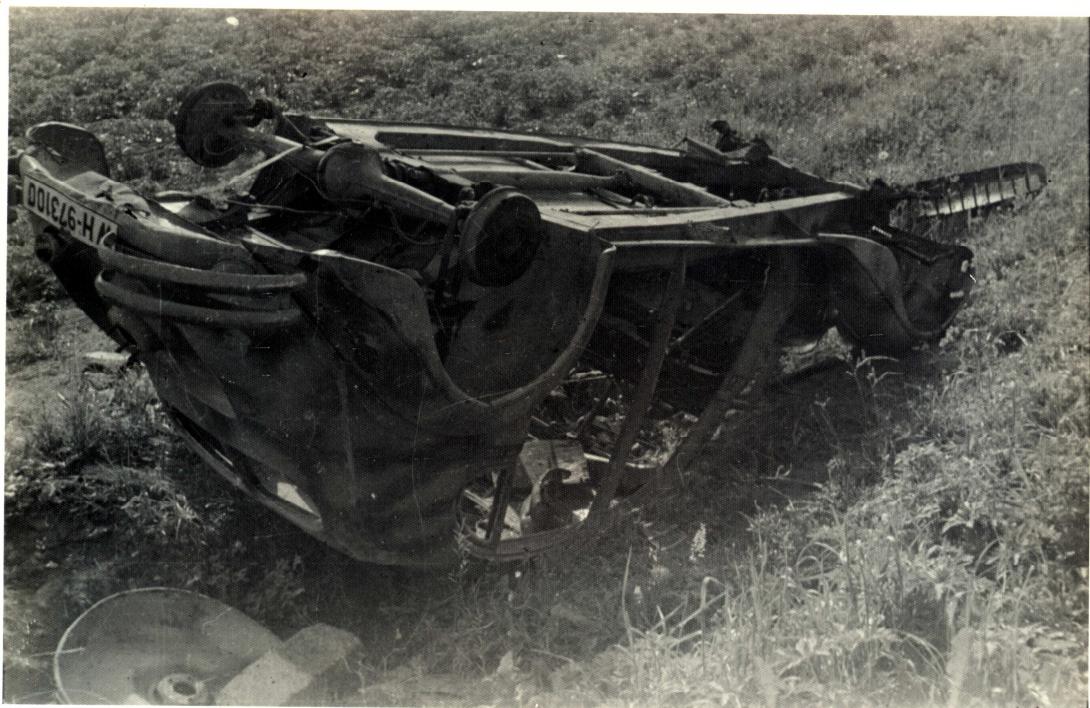
Maskované německé auto směrem na Náměšť u Popovic.