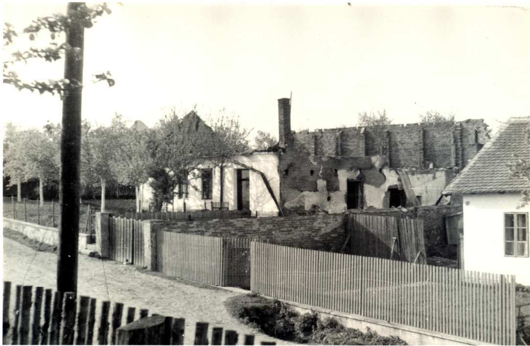
Pelcovi. Nezůstalo jim nic kromě sklenic.