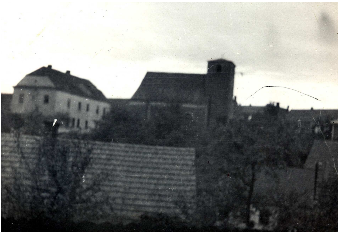
Kostel v Lukovanech.