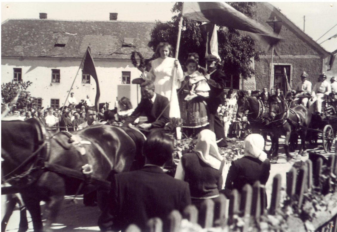
U pomníku padlých.