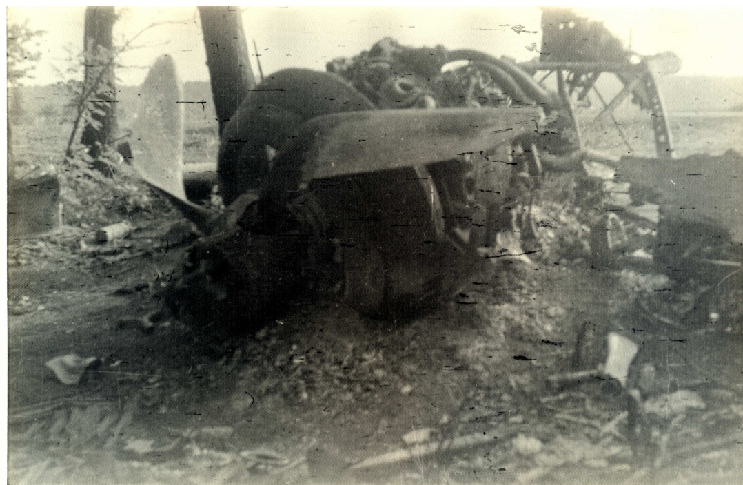
Sestřelené letadlo snad u Rosic.