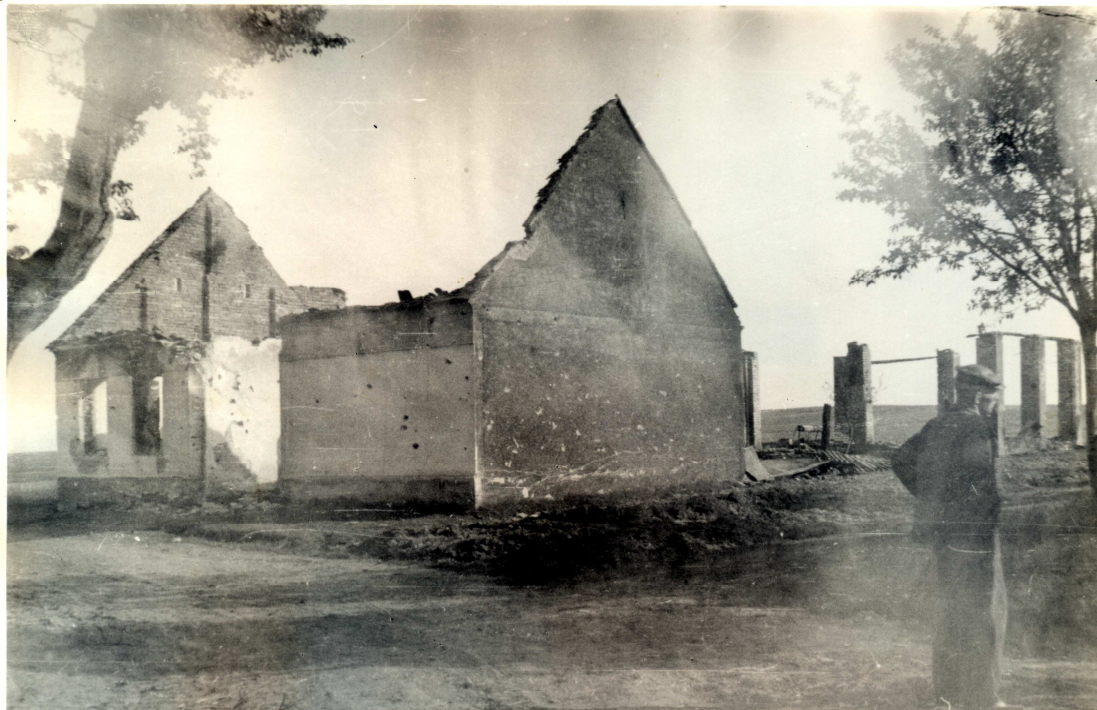
Dům Julia Mistera.