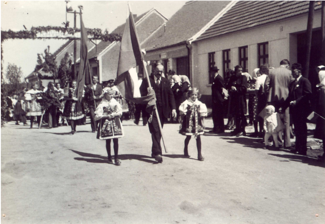
Nápis snad „Pravda zvítězí“