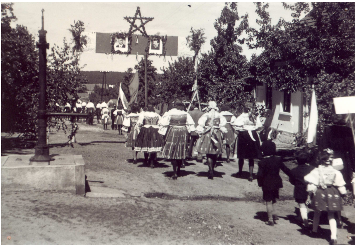
Asi na drahách.