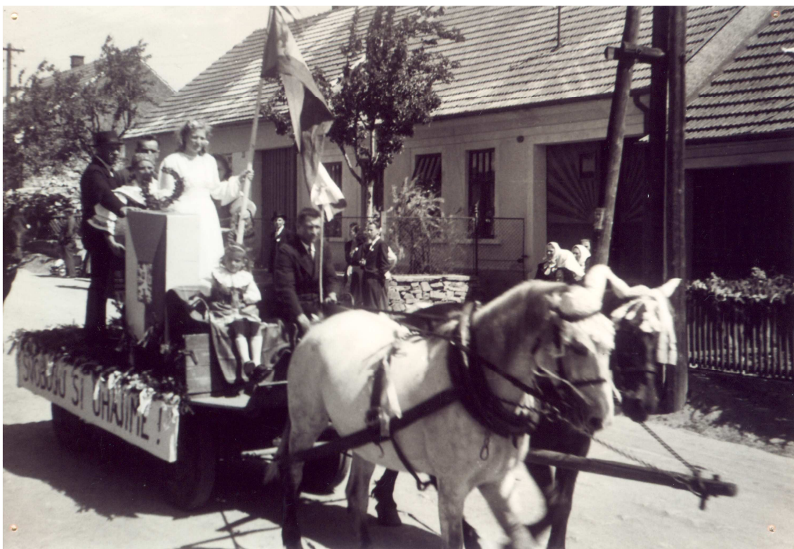
Svobodu si uhájíme.