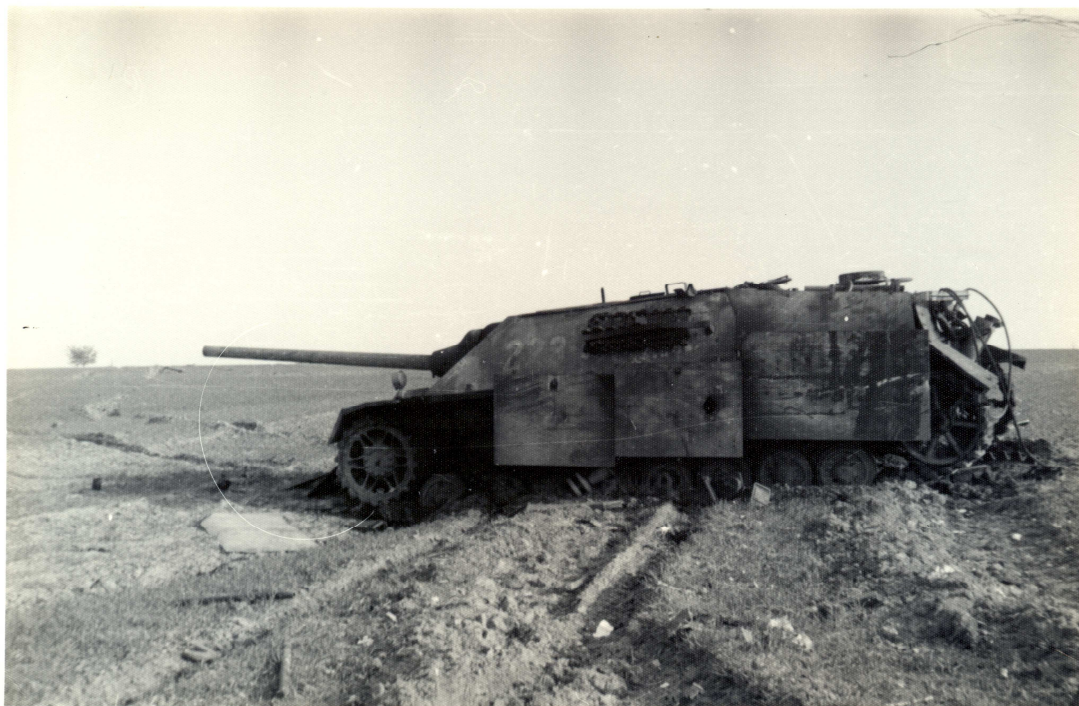
Tank u cesty z Lukovan do Popovic.