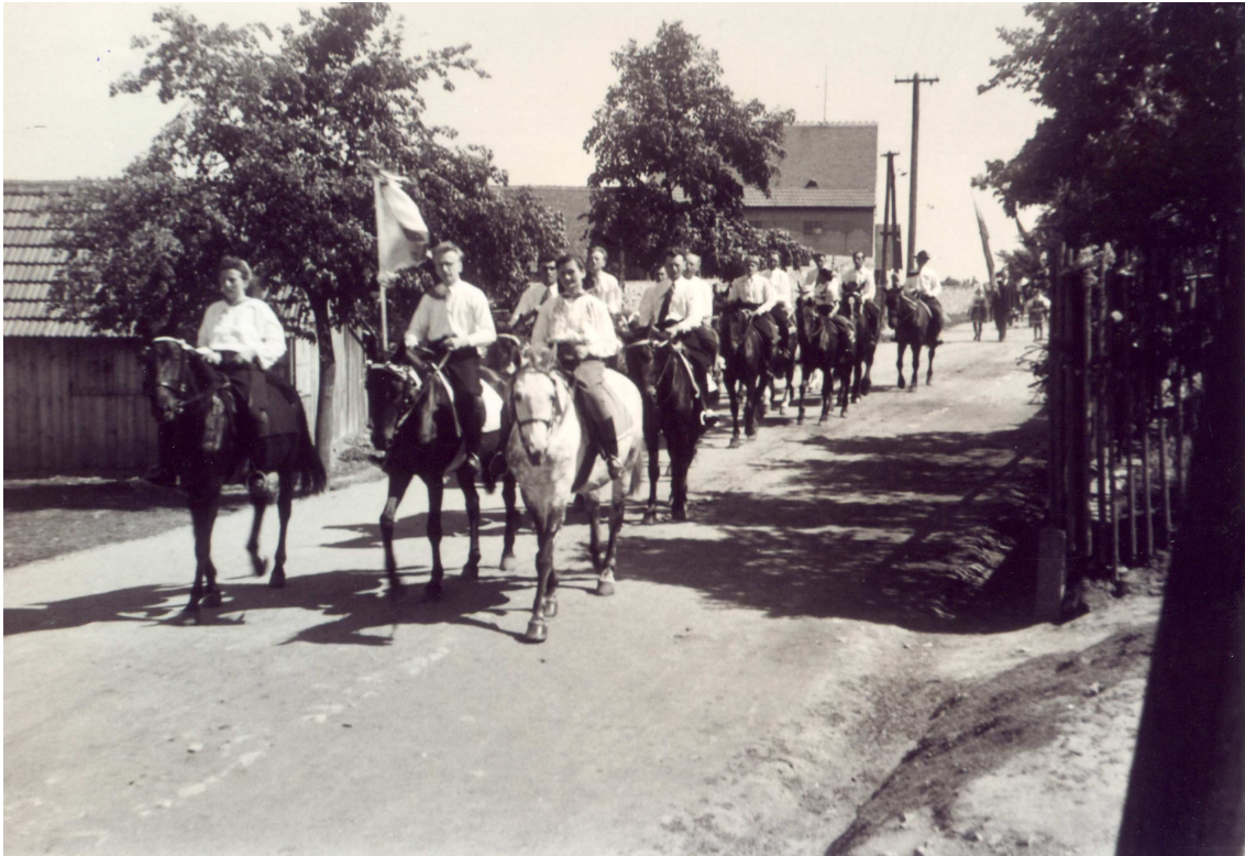
Od hřbitova kolem sýpky státního statku.